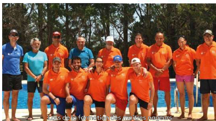
Lors de la formation des maîtres nageurs