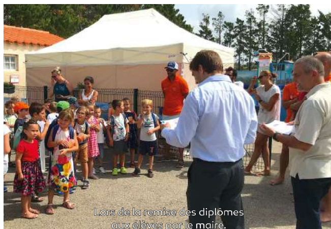
Lors de la remise des diplômes aux élèves par le maire.